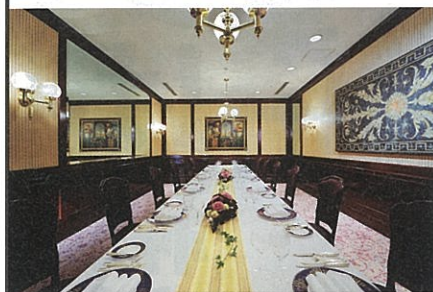
[2F] フレンチ「アンシャンテ」 クラシカルな店内でフランス料理をご堪能いただけるメインダイニング