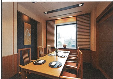
[2F] 日本料理「明石」 熟練の技が織りなす日本料理を落ち着いた雰囲気個室でおもてなし