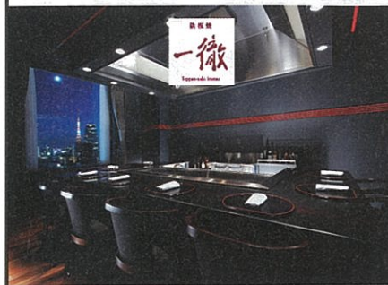
[21F] 鉄板焼「一徹」 最上階からの眺望と神戸ビーフや海の幸をご堪能ください