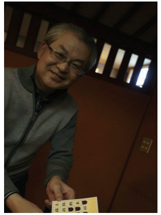
平成23年12月9日 金曜日 午後7時半より福岡市中央区西中洲の博多料理「春駒」にて、平成23年度福岡支部忘年会が開催されました。参加者は28名でした。