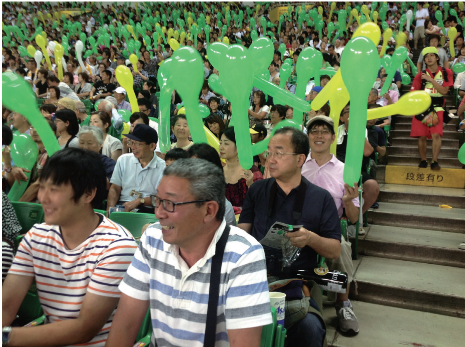
平成24年8月5日(日)ヤフードームにおいて、福岡支部会員懇親野球観戦ツアーが行われた。参加者は41名だった。

今年もソフトバンクホークス対埼玉西武の試合観戦に同窓会福岡支部会員ならびに家族、従業員、総勢41名でヤフードームへ行ってきました。